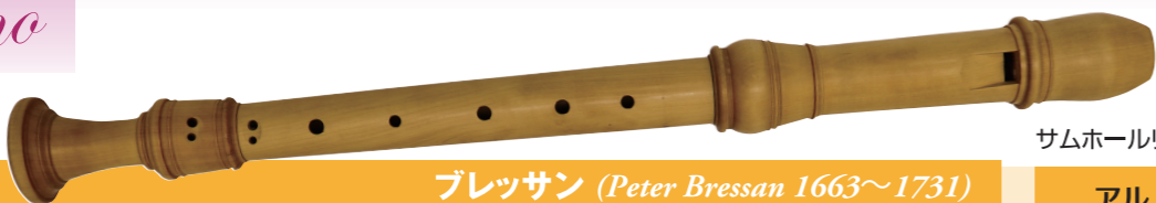
サムホールリング付き