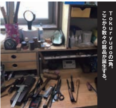
ここから数々の銘品が誕生する。 Tokuryudoの一角。